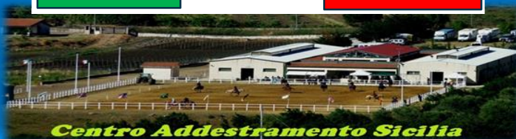
Centro Addestramento Sicilia