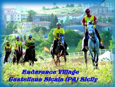
Endurance Village Castellana Sicula (PA) Sicily